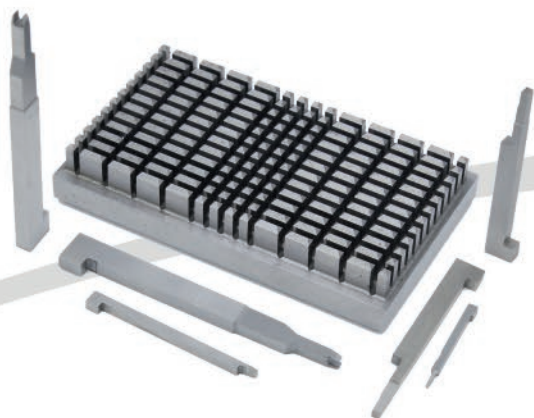
MICRO POSTIÇOS E RIBES